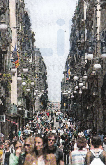
Stradă în Barri Gòtic